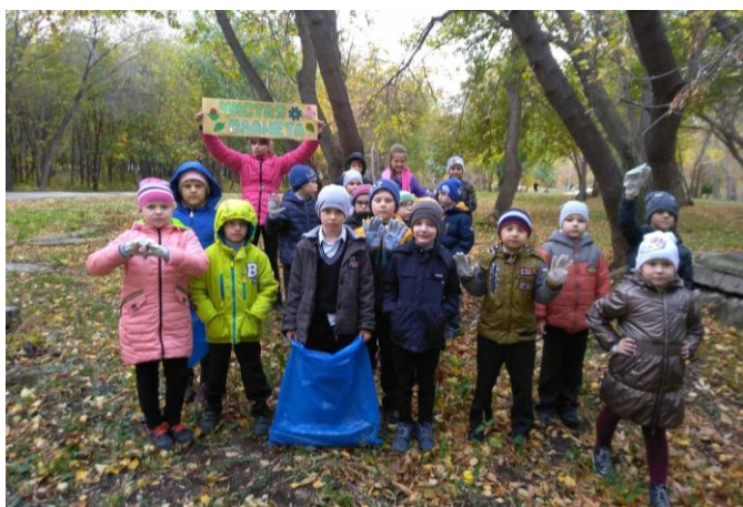
Педагоги-организаторы клубов по месту жительства с воспитанниками приняли активное участие в ЭкоСубботнике «Мой город без экологических проблем».